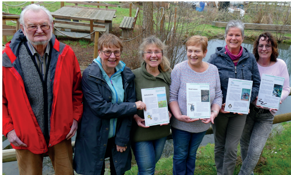
Einige Mitglieder der Natur- und Vogelschutzgruppe mit Mustern der neuen Lehrtafeln.